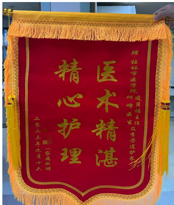
耳鼻咽喉头颈外科