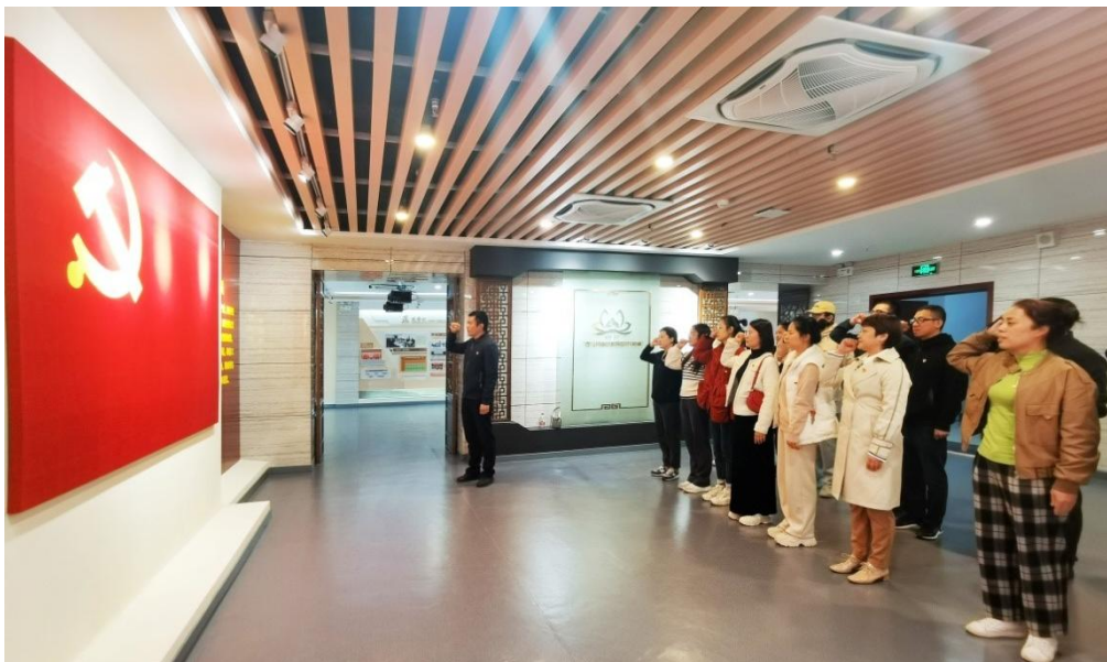
纪检委员重温入党誓词

按照工作安排，医院纪委还将分批次组织其他党支部纪检委员赴桂林市廉政教育基地参观学习，以及开展多种形式的教育培训活动，切实提升党支部纪检委员的政治素养和履职能力。