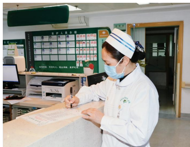
科主任、护士长现场签字