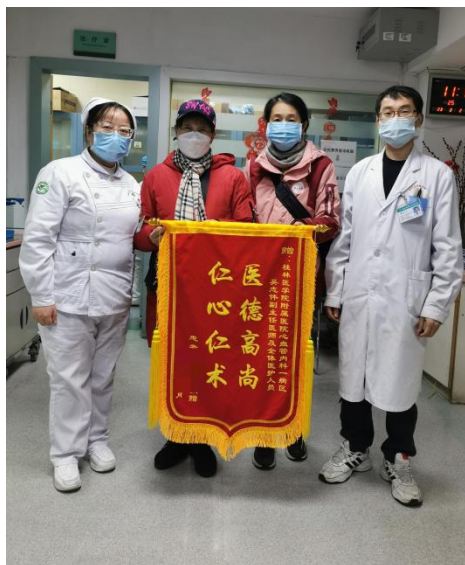
心血管内科一病区