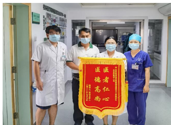
重症医学科一病区