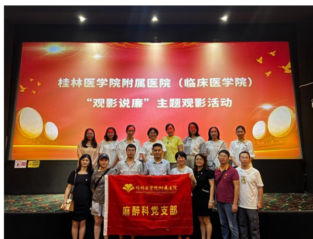
党支部参加“观影说廉”主题观影活动现场照片