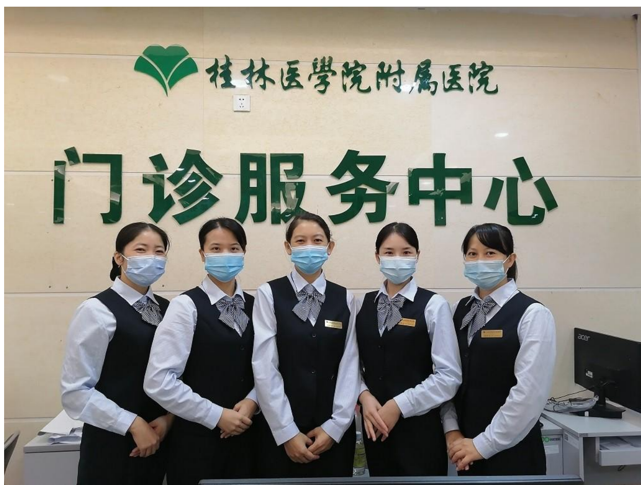
门诊服务中心工作人员合影

“以人为本”的服务理念，“以患者为中心”的服务意识，是我院一直以来不变的“初心”，也是一代代附院人的坚守。下一步，门诊服务中心将继续落实专项行动工作成效，以清廉医院建设为契机，进一步改进工作作风，着力解决患者急、堵、痛、繁的“小事”，持续改善患者就医体验，助力医院高质量发展。