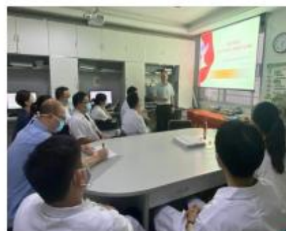
我院党员院领导给支部上对党忠诚主题党课现场